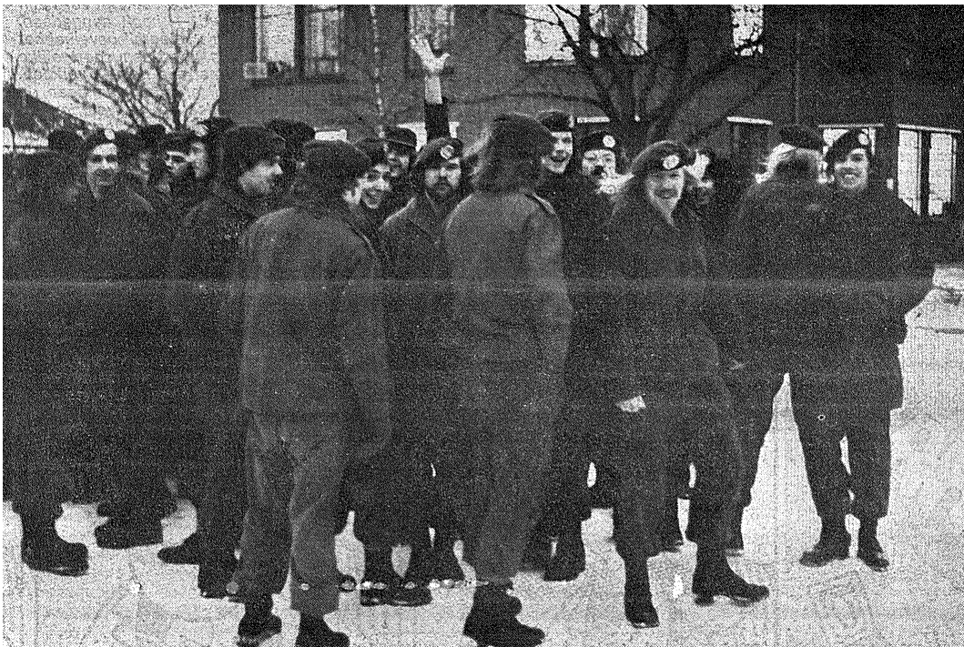
Nog even gaat het er vrolijk aan toe

De soldaten van 44 Pantserinfanteriebataljon (44 Painfbat) hadden een hard hoofd in 'Boemerang' in Sennelager (D), de oefening die voor de week erop op het programma stond. Er waren berichten dat het in West-Duitsland streng vroom en tijdens een aantal andere oefeningen waren soldaten elders in Nederland met bevroeringsverschijnselen in de ziekenboeg opgenomen. In Zuidlaren ontstond onrust, eerder die week had de plaatselijke VVDM-afdeling vergeefs geprobeerd een gesprek te regelen met generaal Zoutenbier, de commandant van 42 Pantserinfanteriebrigade waar 44 Painfbat onder viel. Maar de generaal weigerde een gesprek. Men had hierin willen aandringen op uitstel van de oefening en als dit niet kon kachels in de legeringstenten, extra voeding en medische voorzieningen. De onvrede groeide verder en daarmee ook de actiebereidheid. De VVDM-afdeling stond achter de actieplannen maar kon hier vanwege haar positie niet aan deelnemen. Voor de soldaten maakte dat niet uit en vlak voor het tijdstip waarop normaal de appels gehouden zouden worden stroomden zij het exercitieterrein op.