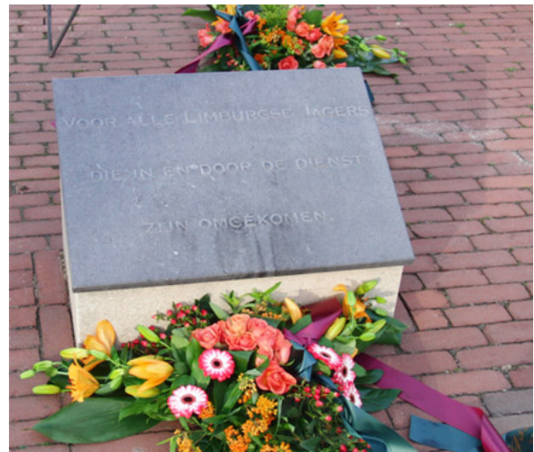
Gedenksteen van de Limburgse Jagers

een monument herdacht op de Generaal Spookazerne. Ook het Regiment Limburgse Jagers herdenkt zijn vredesverliezen, er is een aparte gedenksteen met opschrift: "Voor alle Limburgse Jagers die in en door de dienst zijn omgekomen."